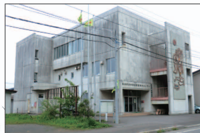
④ 吉岡漁村環境改善総合センター