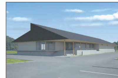
⑤ 吉岡総合センター(完成予想図)

※「高台の避難適地」 津波一時避難場所以外に津波から身の安全を確保することが可能な場所(高台)です。