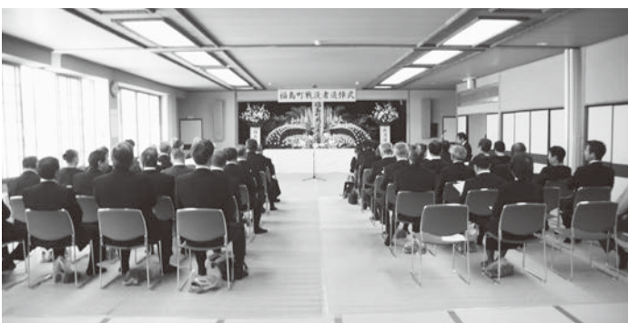
▲昨年の戦没者追悼式

※当日は送迎バスを運行 します。送迎を希望され る方は7月10日(月)ま でに町民課へご連絡をお 願いします。