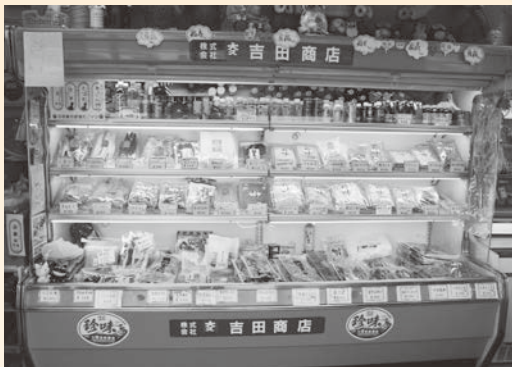
▲品揃え豊富な商品陳列棚

人員が増えたため作業能率が上がりましたが、それだけでなく、工場の雰囲気もより明るくなりました。従業員は年齢が60代後半の方が多く、実習生は20代前半の方が多く、自分の娘のように可愛いです。従業員も実習生をわが子のように可愛がっており、休憩時間には、よくおやつを食べさせているようです。おかげで福島町に来てから、体重が10kg増えた実習生もいるみたいです(笑)。実習生も、「仕事が楽しい」「日本人は親切だ」「食べ物美味しい」と笑みを浮かべながら、よく本音をこぼしています。