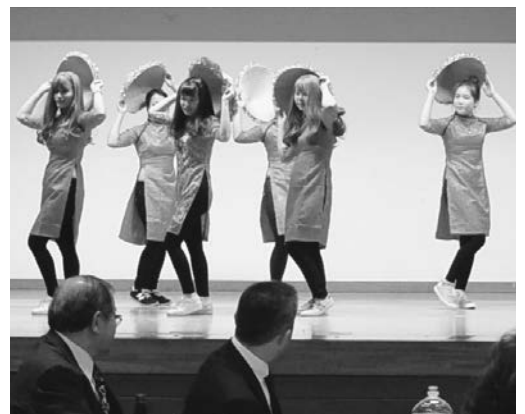
▲外国人技能実習生による踊り

1月9日(火)、町・商工会・観光協会三者合同の新年交礼会及び平成29年度町表彰受章祝賀会並びに平成29年度北海道社会貢献賞・第46回医療功労賞受章祝賀会が福祉センターにて開催され、約140名が出席しました。