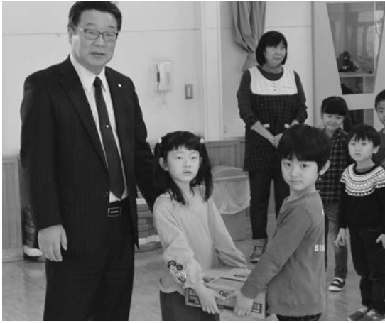
▶プレゼントを受け取る子どもたち (福島保育所)

同社では毎年、年末に福祉施設等へ同社製品を贈呈しており、12月28日(木)に町内の保育所や幼稚園の子どもたち、老人福祉施設の利用者等に贈られました。