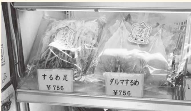
▲部位ごとに分けられたするめは、水産加工品直売所の隠れた人気品

問3. 外国人技能実習生の受け入れ前と受け入れ後で、大きく変化したことは何ですか？