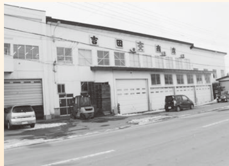
▲するめ等を製造している水産加工場

また、福島町は青函トンネルの工事基地、横綱を2人輩出した地、するめの製造量が日本最大級の町でもあります。水産加工業を通して、先代や漁業、水産加工に携わった方々へ、そして、今後より誇りあふれる町となれるよう、町全体へ恩返しをしていきたいです。