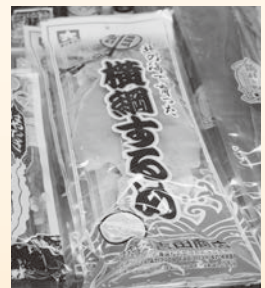
▲水産加工品直売所で1番人気の商品、横綱するめ

創業当時から一緒に仕事をしていた従業員が、高齢のため退職してしまい、人員不足に陥りました。その頃は町内に水産加工場が27軒ありましたが、現在に至っては8軒にまで減少しています。このままでは福島町の水産加工が衰退してしまうと思ひ、人員の確保を図りました。しかし、町内の若者は都会へ出てしまつていくことが多く…。そこで、福島町の水産加工技術を町外にも継いでいきたいという思いから、8年前より外国人技能実習生を受け入れることにしました。直接中国へ行って、人材会社を通して面接を行い、中国人の外国人技能実習生を受け入れました。現在は中国人3名、ベトナム人12名の実習生を受け入れています。実習期間は3年で、実習が終了した実習生は身に付けた技術を活かしながら、地元で働いています。