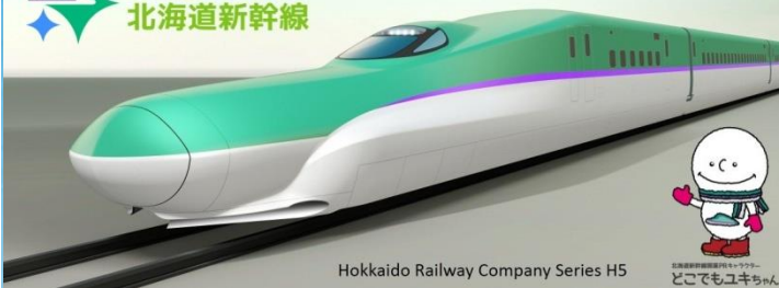
Hokkaido Railway Company Series H5