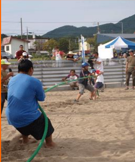
●九重部屋の力士と「綱引き大会」

夏のフィナーレを、弾けるパワーで彩る。 夏合宿中の九重部屋の力士達や、地元町民、帰省客 や観光客が交わって町中祭り一色！！