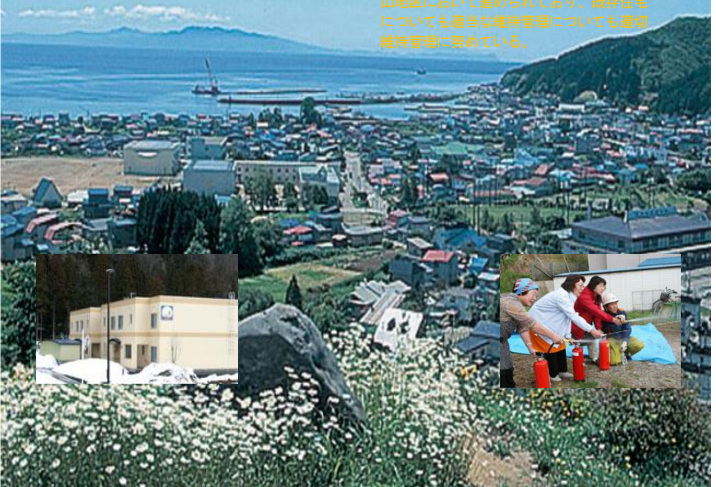
どこでもユキちゃん