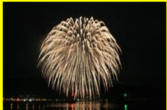
●津軽海峡をバックに「海峡花火大会」。