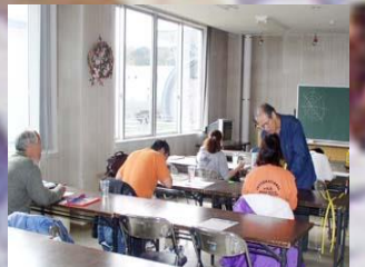
●健康フェスティバル