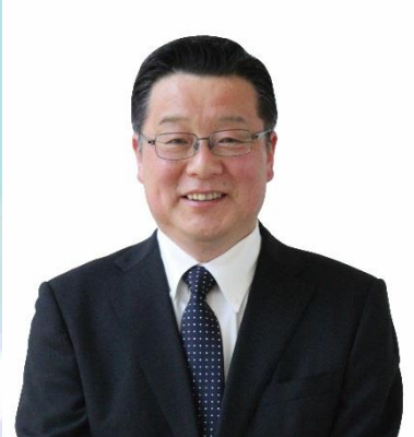
鳴海 清春 町長

福島町は、町民と協働によるまちづくりを進めるため、まちづくり基本条例に基づき、まちづくりの主体である町民と、町民からまちづくりの仕事を託された議会・行政が一体となって、「住んでいてよかった」「これからも住み続けたい」と思えるまちづくりの創造を目指します。