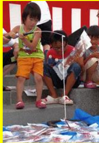
●福島の特産品を生かした「スルメ釣り大会」。 毎年趣向を凝らした様々なイベントが行われている。