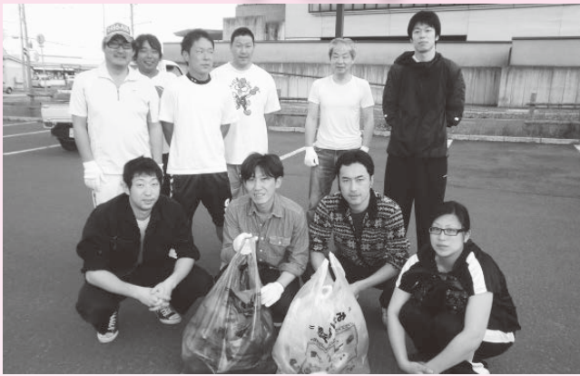
▲『町内のごみ拾い活動』の様子