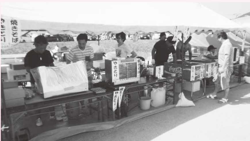
▲『やるべ福島イカまつり』会場での出店準備の様子

その他の事業としては、交通安全全啓発運動の一環として部員の車にパトライトを取りつけて町内を巡回する『パトライト作戦』や、地域貢献や福祉向上を目的とした『町内のごみ拾い活動』、『献血運動協力』、親睦を深めるための『視察研修』や、各行事の『懇親会』等を実施しています。