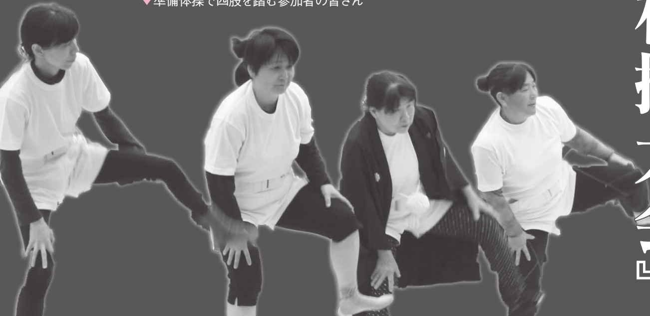
▼準備体操で四股を踏む参加者の皆さん