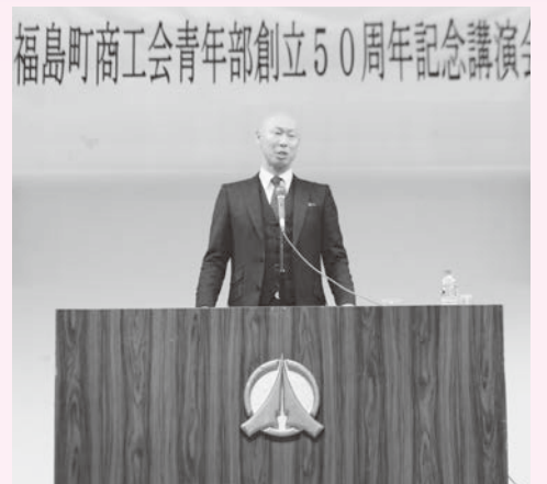
▲『記念講演会』の様子

家業を継ぐため、都市部から福島町の実家に戻ってきた部員が多いです。しかし、いくら地元といっても、仕事をする上で顔や名前を熟知している訳ではありません。さまざまな青年部事業を通じて、部員同士の交流はもちろんですが、町内外の方々との交流を広げることもでき、各部員がこの町で生活していく上での大切な財産になっていると感じています。