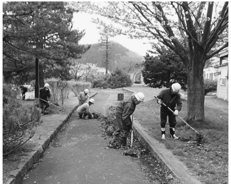
▲従業員による清掃活動の様子