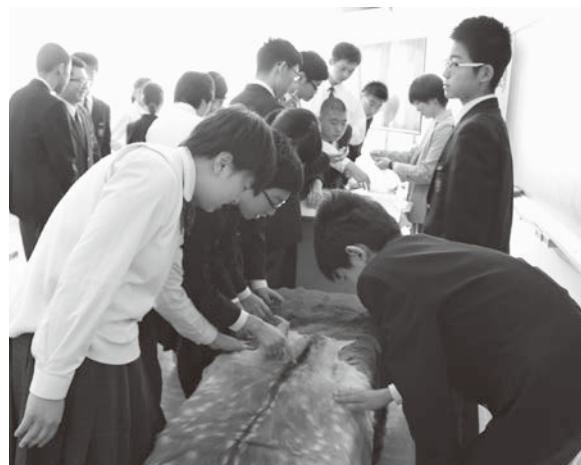
◀夏毛と冬毛の違いを触って確認