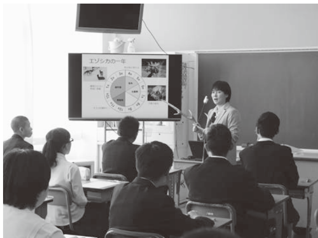
◀エゾシカの1年を勉強中