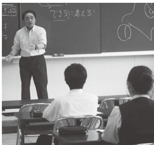
◀生徒たちの笑いが絶えない講演でした

講演が終わった後、生徒が考案している商品開発に様々なアドバイスをしていただきました。