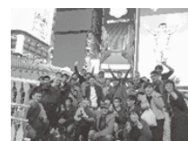
大阪・道頓堀に 行ってきたよ～！