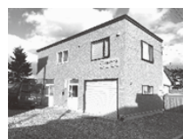
新規開設しました！