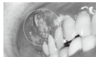
右上の歯肉に発生した 歯肉がん