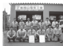
営業所の社員です 社員募集中