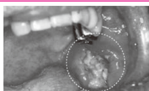
左のほおの内側に発生した 頬粘膜がん