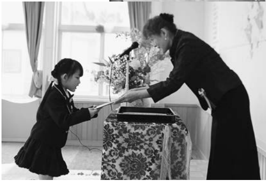
▲金澤園長より保育証書を受け取る卒園児