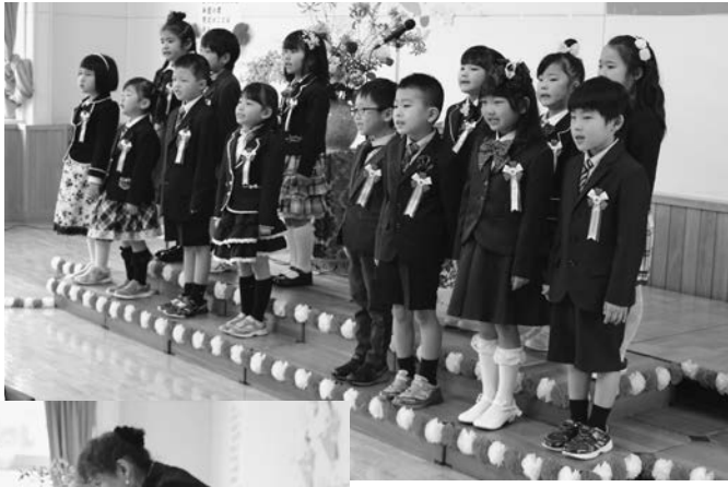
▲元気に歌を歌う卒園児