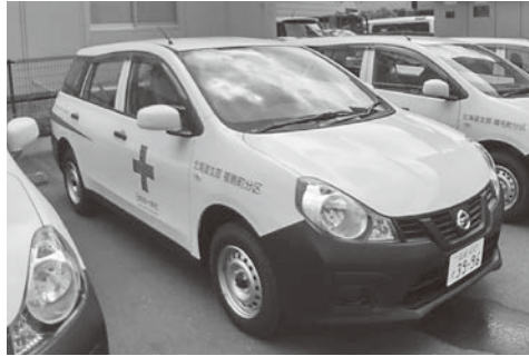
▲配置された博愛号