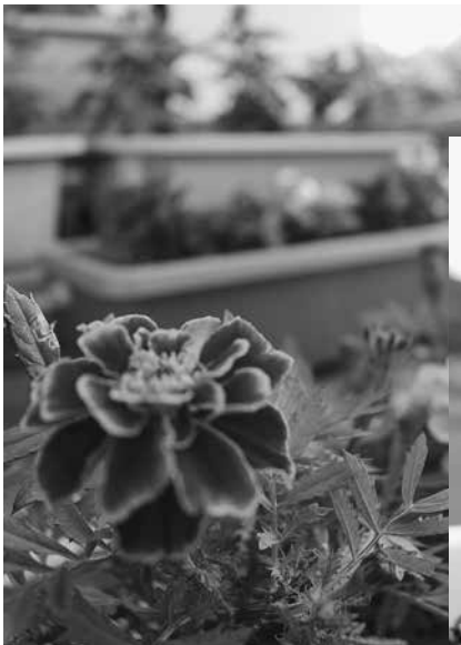
植えられた花々 （左：丸山地区 右：吉岡地区）