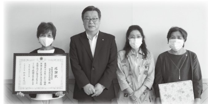
左から、阿部部長、鳴海町長、阿部副部長、湊副部長