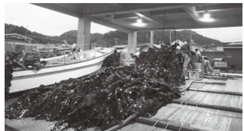
昆布洗浄作業などを行う漁業関係者（福島漁港）