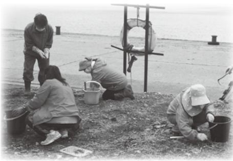
福島漁港の清掃活動

4月に札幌で開催された表彰式に出席することが出来なかったため、後日、鳴海町長より北海道知事感謝状が代理伝達されました。