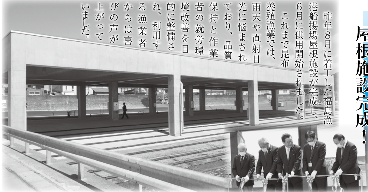
完成した船揚場屋根施設

昨年8月に着工した福島漁港船揚場屋根施設が完成し、6月に供用開始されました。これまで昆布養殖漁業では、雨天や直射日光に悩まされ、品質保持と作業者の就労環境改善を目的に整備され、利用する漁業者からは喜びの声が上がっていました。