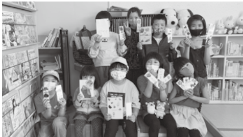
図書室ホームページはこちらから!! ↓