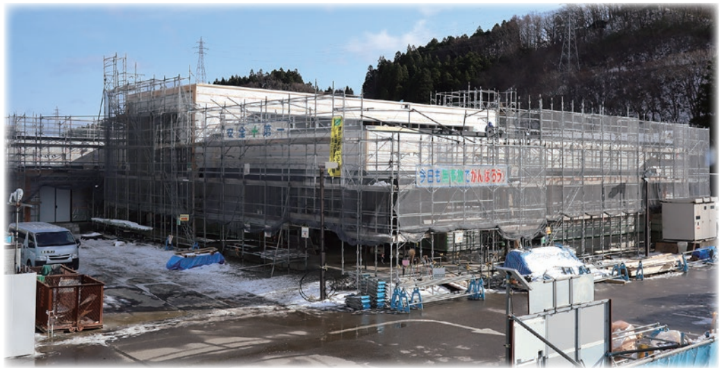
建設工事の進捗状況 (12/15現在)

新築工事は順調に進んでおり、すでに土台や骨組みが完成し、外壁などの工事に入っています。今後は、建物の内部工事を中心に作業が行われます。