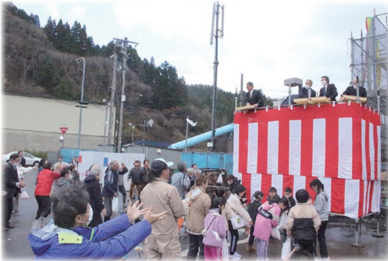
上棟式で行われた餅まき

上棟式にあわせて餅まきも行われ、吉岡小学校の児童や地域住民が参加し、歓声を上げていました。