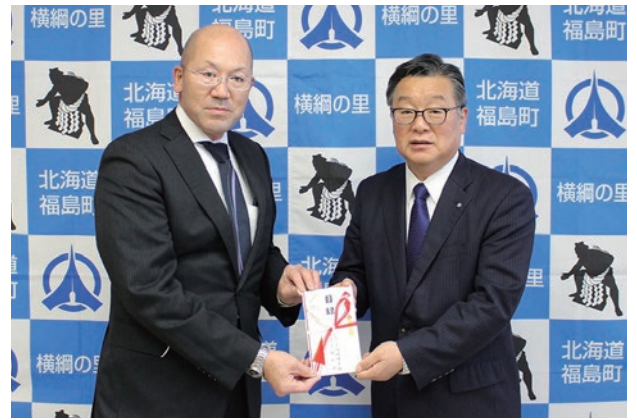
左から上嶋代表取締役、鳴海町長

有限会社上嶋環境営繕に感謝申し上げるとともに、更なるご発展をお祈り申し上げます。