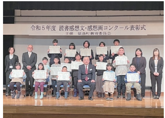
読書感想画で受賞した皆さん