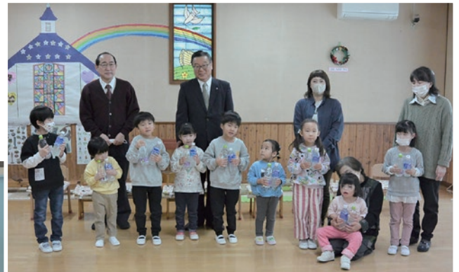
飲み物を受取る園児たち