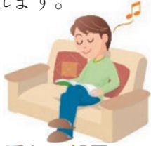
暖かい部屋での 血圧は安定

急激な温度の変化によって、血圧が上下に大きく変動することがきっかけで起きます。 特に、入浴時に暖かい部屋から寒い脱衣所や浴室へ移動し、熱い湯船に浸かることで血圧が急変動し、意識障害や不整脈などを起こし、浴室での転倒や浴槽で溺れる原因となっていると考えられます。