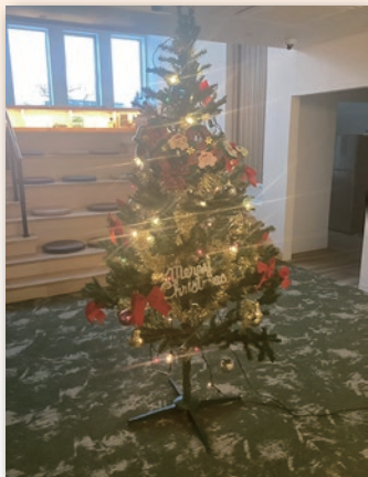
寮母さんのお宅から貸していた いただいたクリスマスツリー

最後になりましたが、皆さまのご健康とご多幸を心よりお祈り申し上げますとともに、本年も倍旧のご厚情を賜りますようお願いいたします。