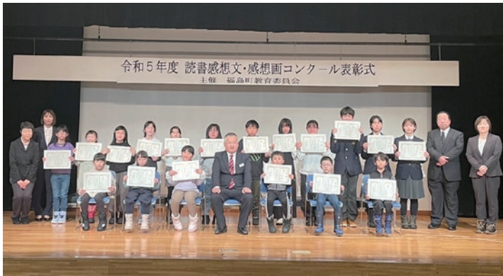
読書感想文で受賞した皆さん