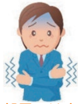
寒い部屋では血管が 収縮し血圧が上昇