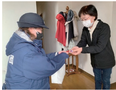
※平成23年6月1日から住宅用火災警報器の設置が義務になりました。