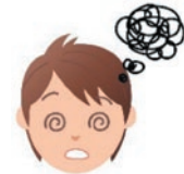
血圧が急激に上下すること で、脳に十分な血液が送ら れなくなり症状が現れます