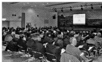
合併問題についての町民懇談会(2004年12月)

この3つの視点で、全国の先進事例を参考にしながら「気がついたことから・できることから」を合言葉に現行法でできる