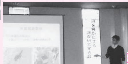
発表する高特任研究員