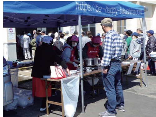
直売会の様子（漁協吉岡本所荷捌所）