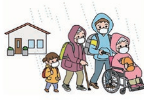
警戒レベル 3 高齢者等避難