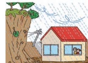
警戒レベル 5 緊急安全確保 崖から離れた部屋へ移動