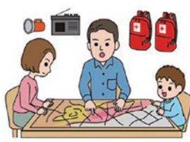
警戒レベル 2 自らの避難行動を確認