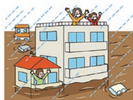
警戒レベル 5 緊急安全確保 近隣の建物の上階へ移動