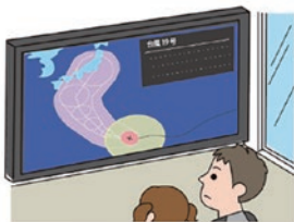
警戒レベル 1 災害への心構えを高める