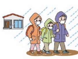
警戒レベル 4 避難指示