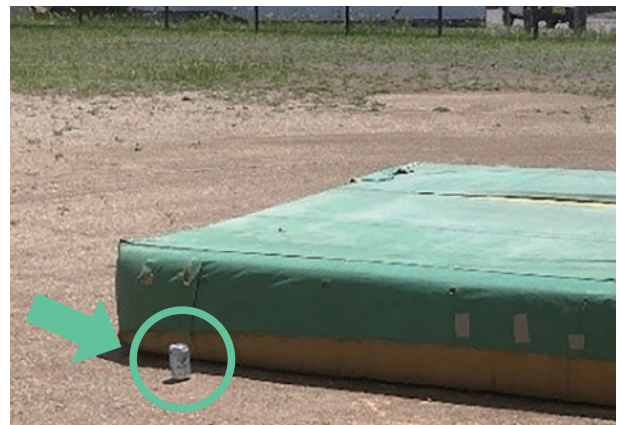
▲グラウンド内に空き缶と吸い殻が放置